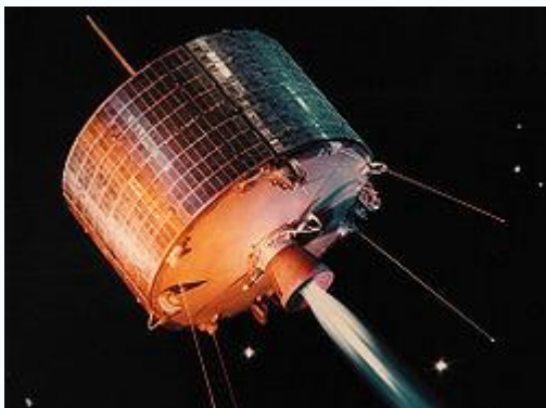
Спутник связи Syncom-1

Материал из Википедии — свободной энциклопедии