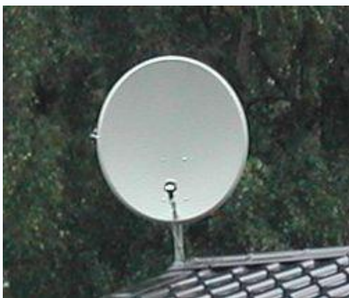
Антенна для приема спутникового телевидения (Ku-диапазон)