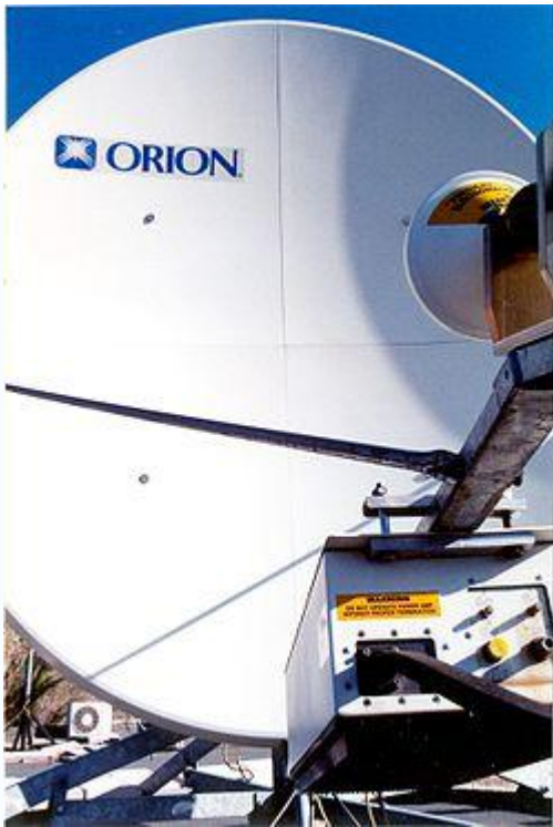
Антенна терминала VSAT