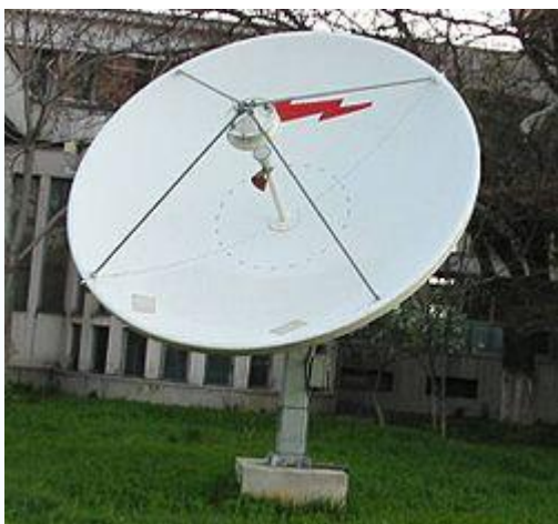
Спутниковая антенна для С-диапазона

Выбор частоты для передачи данных от земной станции к спутнику и от спутника к земной станции не является произвольным. От частоты зависит, например, поглощение радиоволн в атмосфере , а также необходимые размеры передающей и приемной антенн. Частоты, на которых происходит передача от земной станции к спутнику, отличаются от частот, используемых для передачи от спутника к земной станции (как правило, первые выше).